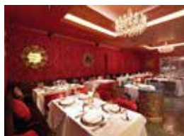
7. Ambrosia Private Club Jakarta, Indonesia