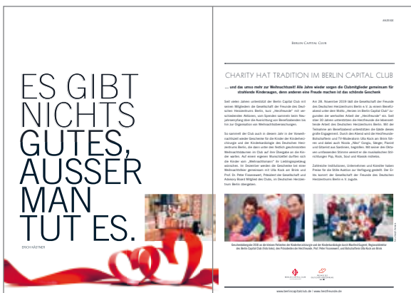
Berlin vis. à vis Charity hat Tradition im Berlin Capital Club