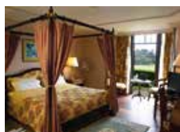
14. Windsor Golf Hotel & Country Club Nairobi, Kenia