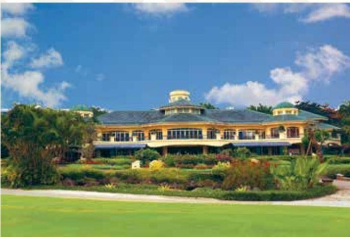
Rancamaya Golf & Country Club, Bogo, Indonesien