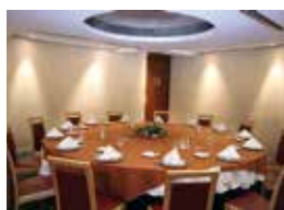
18. University Club of Mexico Mexiko City