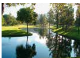
20. Calabasas Country Club Calabasas, Kalifornien, USA