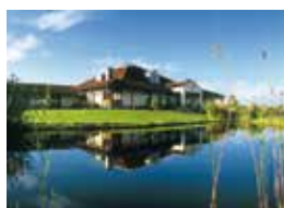
23. Berliner Golf & Country Club Motzener See e.V. Mittenwalde, Deutschland