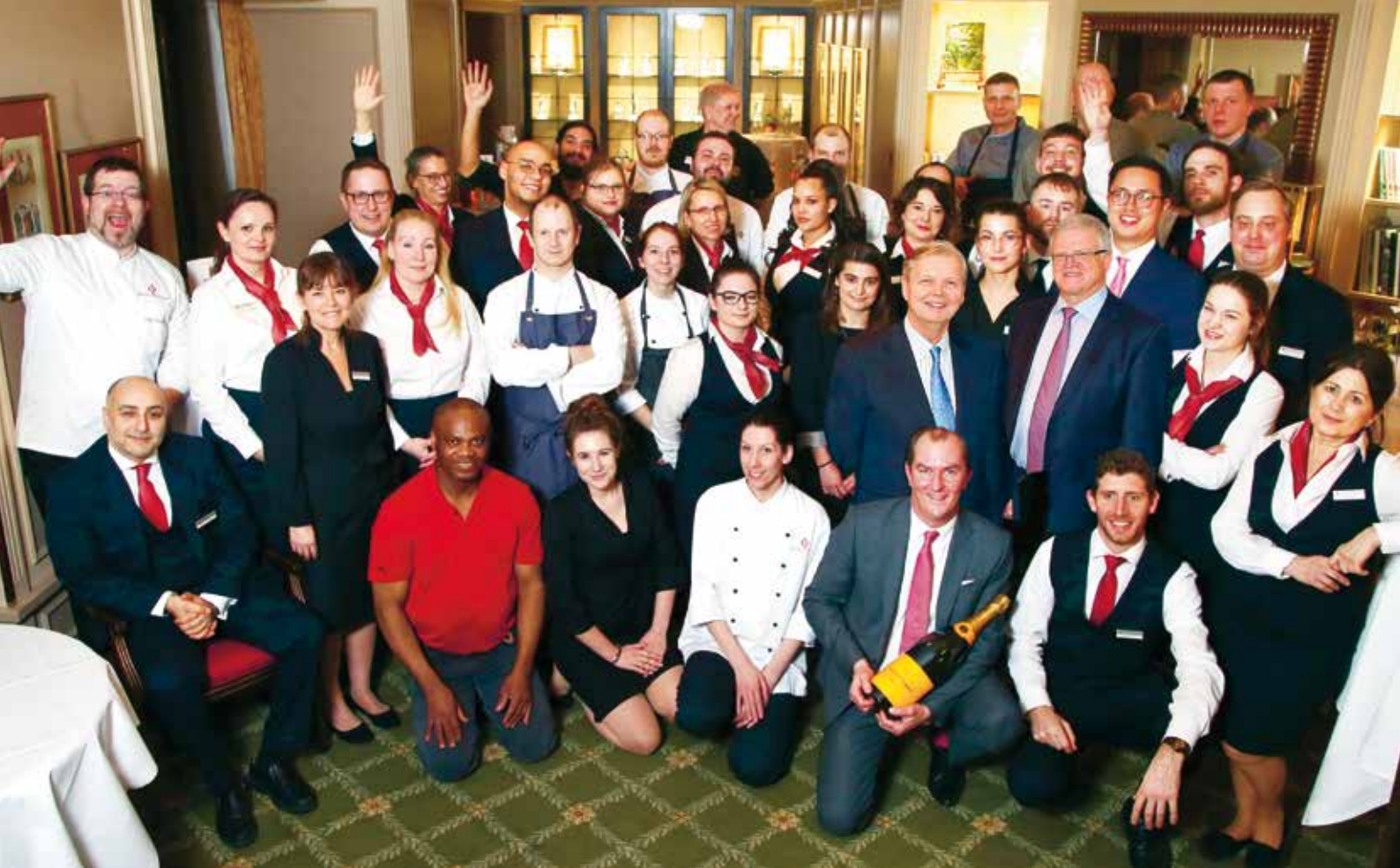
Wir freuen uns auf ein erfolgreiches gemeinsames Jahr 2020 und auf Ihre Besuche im Club!