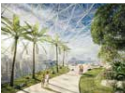
6. The Private Club at Raffles City Chongqing, China