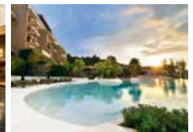
5. Sunplay Club Pattaya, Thailand