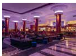
16. City Tattersall's Club Sydney, Australien