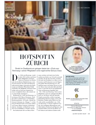
Falstaff Gourmet Magazin Club zum Rennweg, Zürich: Hotspot in Zürich