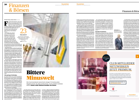
Handelsblatt Clubmitglieder netzwerken jetzt PREMIUM