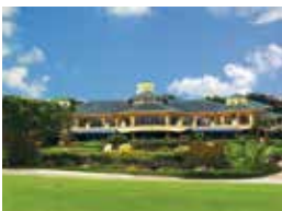
1. Rancamaya Golf & Country Club Jakarta, Indonesia