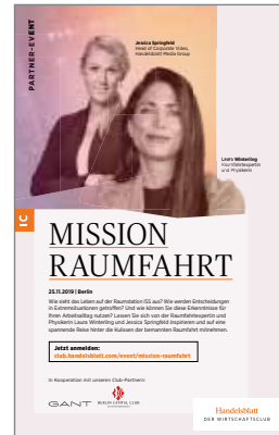
Handelsblatt Mission Raumfahrt Event im Berlin Capital Club