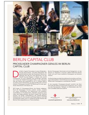
Berlinerin Falstaff Champagner Gala im Berlin Capital Club