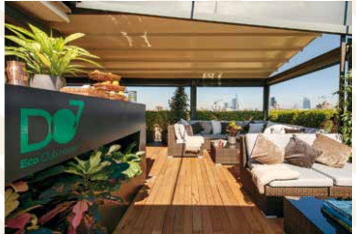
DO7 Eco Club House, Mailand, Italien