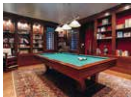
2. The Wingtip San Francisco, USA