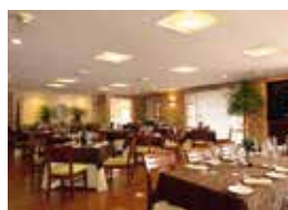
19. Country Club Ejecutivos Medellin, Columbien