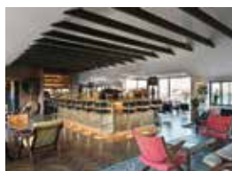
13. Vinnustofa Kjarval Reykjavik, Island