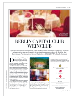
Falstaff Gourmet Magazin Berlin Capital Club: Weinclub Events