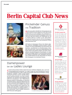
TOP Magazin Berlin Capital Club News