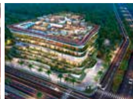
3. Empyrean Club Jaipur, Indien