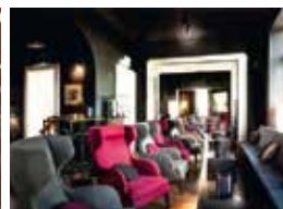
8. House17 Luxembourg, Luxembourg