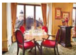
22. Berlin Capital Club Berlin, Deutschland