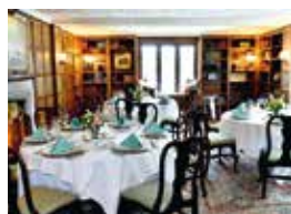
11. The Village Club Bloomfield Hills, Michigan, USA