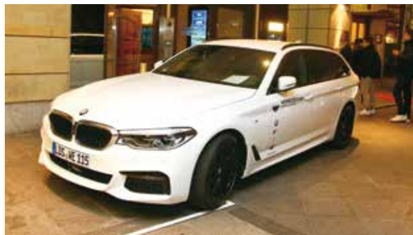
Der BMW 520d Touring aus dem Autohaus Wernecke GmbH