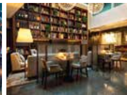
4. D07 Eco Club House Milan, Italien