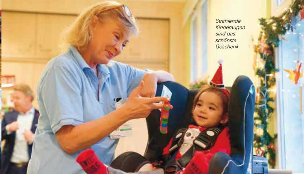
Strahlende Kinderaugen sind das schönste Geschenk.