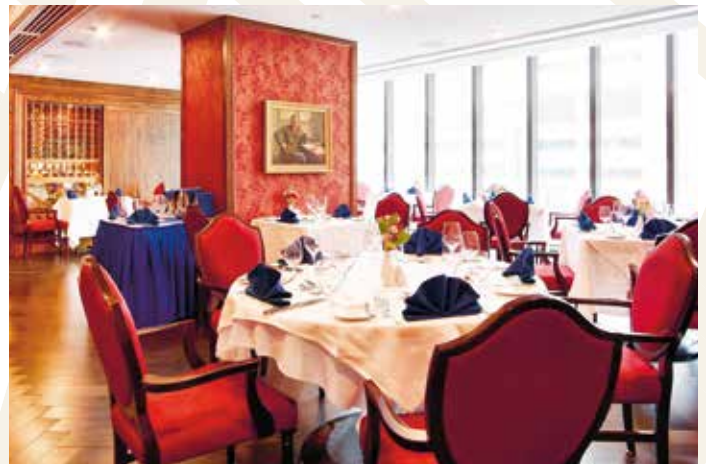
Royal Canadian Military Institute, Toronto, Kanada

Als Mitglied des Berlin Capital Club haben Sie die Möglichkeit, fast 250 exklusive Stadt-, Sport-, Country- und Golfclubs gegen Vorlage Ihrer persönlichen IAC-Karte weltweit zu nutzen. So bieten Ihnen die renommierten Clubs in vielen internationalen Metropolen ein „Home away from Home“.