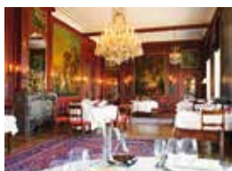
12. Cercle de Wallonie Namur, Belgien