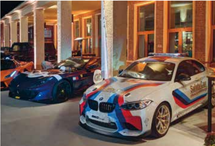
Drivers & Business Club Munich, München, Deutschland