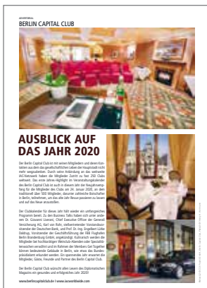
Diplomatisches Magazin Berlin Capital Club – Ausblick 2020