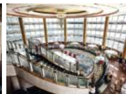
9. Malaysian Petroleum Club Kuala Lumpur, Malaysia