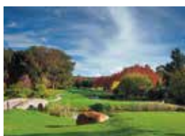
15. The Bryanston Country Club Johannesburg, South Africa