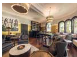
17. The Northern Club Auckland, New Zealand