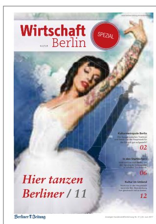
Wirtschaft Berlin Ausgabe 20. Juni 2017

Regelmäßig veranstaltet der DuMont Berliner Verlag im Club einen runden Tisch zu aktuellen Themen aus Politik, Sport, Kultur u. a., über welchen dann in einer Verlagsbeilage der Berliner Zeitung berichtet wird. Bei jedem runden Tisch lädt die Chefredaktion dazu Entscheider und Macher aus dem jeweiligen Bereich zum Hintergrundgespräch ein. Wir freuen uns im Club schon auf den nächsten runden Tisch mit unserem Partner, der Berliner Zeitung, wenn es am 19. September 2017 um den Berlin-Tourismus geht.