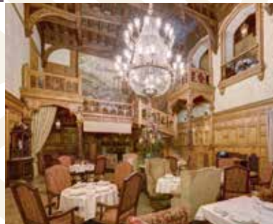
Moscow Capital Club, Russland