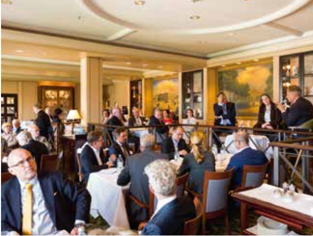
80 interessierte Mitglieder und Gäste des VBKI kamen in den Berlin Capital Club zum Foreign Policy Lunch.