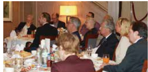
Das Thema Managerhaftung interessierte viele Mitglieder.