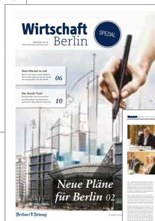
Wirtschaft Berlin Ausgabe 4 Juli 2017