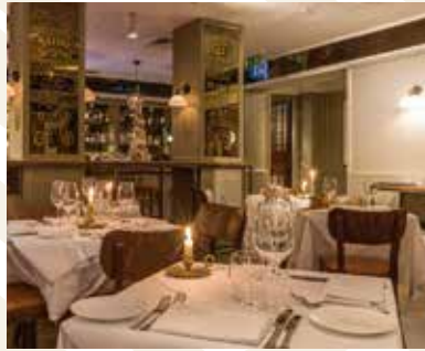
London Capital Club, Großbritannien