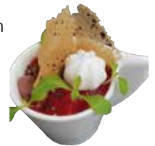
Spargelmousse Erdbeere und Schokolade