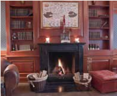
Havana Lounge Bremen, Deutschland