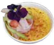
Spargel Creme Brûlée und Spargel-Himbeersalat

manager lounge Der Businessclub des manager magazins