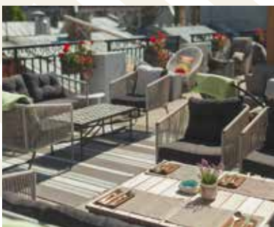
The Lobby, Riga, Lettland

Als Mitglied des Berlin Capital Club haben Sie die Möglichkeit, fast 250 exklusive Stadt-, Sport-, Country- und Golfclubs gegen Vorlage Ihrer persönlichen IAC-Karte weltweit zu nutzen. So bieten Ihnen die renommierten Clubs in vielen internationalen Metropolen ein „Home away from Home“.