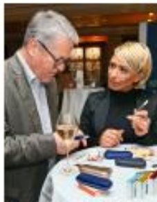
Mehr über Produkte erfahren, interessante Gespräche führen, neue Leute kennenlernen: beim „Gentlemen Only“-Treffen im Berlin Capital Club am Gendarmenmarkt