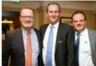
Unter dem Motto „Gentlemen Only“ gab es Ende November im Berlin Capital Club einen Abend voller Luxus, Eleganz und Genuss – für den Mann. Es präsentierten sich u.a. Colson Lederpflege, Vuave Cigarrat, Rubmarl, Hennessy, Yachtors, Jeweller Lochle und Zigarren Herzog