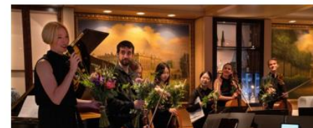
14. Juni

Soiree der Kurt-Sanderling-Akademie des Konzerthausorchester Berlin mit Joana Mallwitz