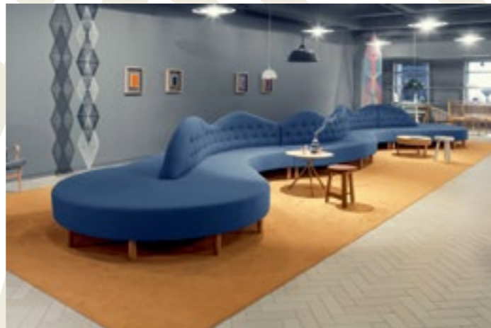
Alma, Stockholm, Schweden

Als Mitglied des Berlin Capital Club haben Sie die Möglichkeit, fast 250 exklusive Stadt-, Sport-, Country- und Golfclubs gegen Vorlage Ihrer persönlichen IAC-Karte weltweit zu nutzen. So bieten Ihnen die renommierten Clubs in vielen internationalen Metropolen ein „Home away from Home“.