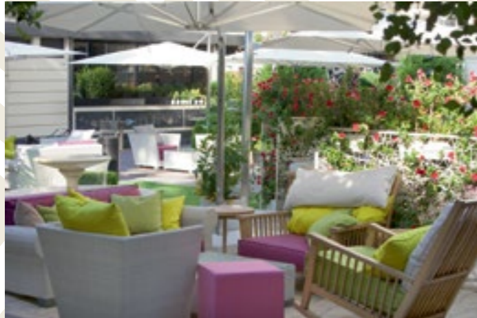
The Residence Exclusive Club, Sofia, Bulgarien