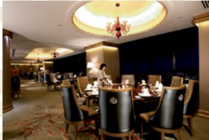
Tower Club Singapore, Singapore