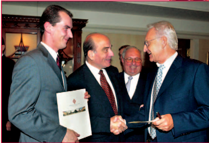
Beim frühmorgendlichen Politiker-Frühstück mit Edmund Stoiber waren selbst die großzügigen Clubräumlichkeiten des Berlin Capital Club bis auf den letzten Platz gefüllt.