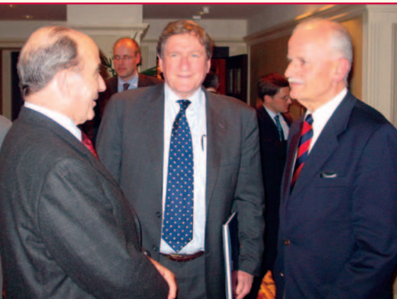
Botschafter Richard C. Holbrooke ist gern und häufig gesehener Gast im Berlin Capital Club – Internationalität par excellence.