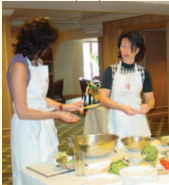
Unsere Clubdamen beim Fisch-Kochkurs