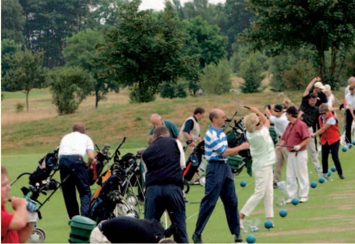
Bevor es losging, war die angemessene Vorbereitung gefragt. Die Teilnehmer hier beim Warmspielen.

Am 15. Juli war es endlich so weit: Der 1. Berlin Capital Club Golf-Cup wurde auf dem Gelände des Berliner Golf & Country Club Motzener See ausgetragen. Die Members konnten sich sportlich betätigen, die wohlschmeckende Verpflegung genießen und die Preisverleihung sowie eine rauschende Abendveranstaltung erleben. Morgens um 10.00 Uhr ging es los. Im Clubhaus wartete ein kleines exklusives Frühstücksbuffet auf alle Teilnehmer.