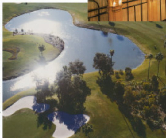
The Country Club, Sanctuary Cove, Queensland, Australia