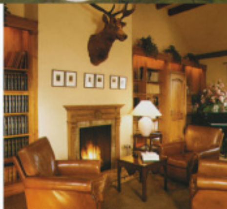
Cercle Munster, Luxembourg