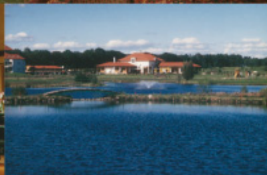
Berlin Golf & Country Club, Berlin, Germany

Das IAC Service Center steht den Mitgliedern des Berlin Capital Club jederzeit zur Verfügung und vor allem mit Rat und Tat zur Seite. Exzellenter Kundenservice und individuelle Beratung stehen dabei für uns im Vordergrund.