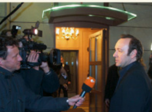
Kevin Spacey beantwortet geduldig die vielen Fragen der Reporter vor den Türen des Berlin Capital Club

Leinwandstars hautnah: Im Rahmen der 53. Berlinale im Berlinale-Palast fand die Premiere des Films „The life of David Gale“ mit Kevin Spacey in der Hauptrolle statt. Im Anschluss an die Vorstellung gab sich United International Pictures, vertreten durch