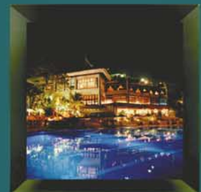
The British Club Singapore