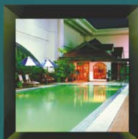
Mercantile Athletic Club Jakarta, Indonesia