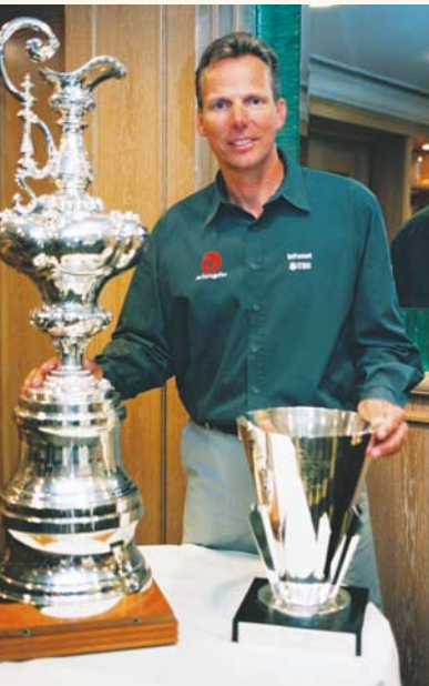
Jochen Schümann mit Trophäe

Eine Premiere in Deutschland: Zum ersten Mal ist der original „Auld Mug“ – die weltbekannte und weltälteste Segeltrophäe – auf deutschem Boden zu bewundern. So geschehen Anfang Mai im Berlin Capital Club. Jochen Schümann, der Sieger des America's Cup, der wichtigsten Regatta der Welt, und mehrfacher Olympiasieger ging im Berlin Capital Club an Bord und stand dem Publikum gern Rede und Antwort. Er präsentierte stolz den gewonnenen Pokal.