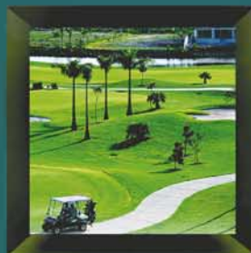
Noosa Springs Country Club Queensland, Australia

As an IAC member you will benefit from visitor privileges at a selection of illustrious clubs located outside of a 200 kilometres radius from your home base. We invite you to enter our website and identify your home club's reciprocal privileges within the network. In case you do not already have an IAC card, please contact your home club's membership department.