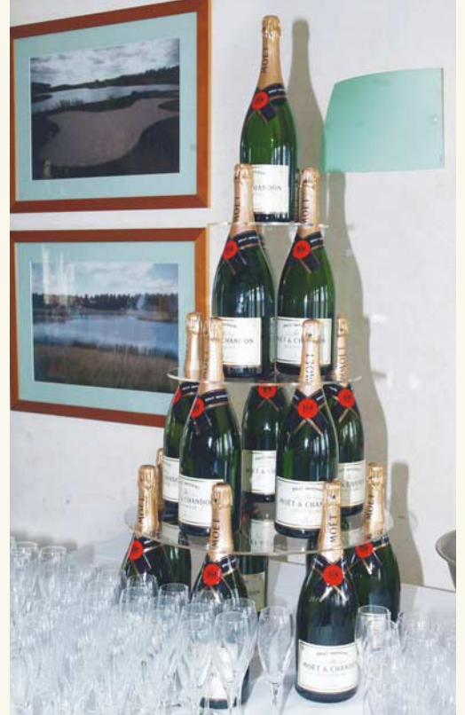
Champagner-Pyramide für die Golf-Damen: Die Preise wurden freundlicherweise von der Firma Louis Vuitton Moët Hennessy Deutschland zur Verfügung gestellt