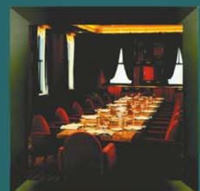
The Rockefeller Center Club New York, USA