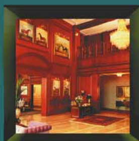
Bankers Club Kuala Lumpur, Malaysia