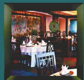
Tower Club Manila, Philippines