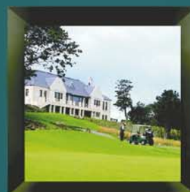
The Duke's Golf Club St. Andrews, United Kingdom