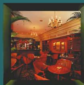
Mercantile Club Jakarta, Indonesia