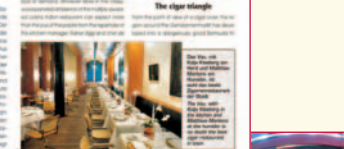
The cigar lounge

Die Cigars Lounge ist ein Ort, an dem man sich entspannen und die Welt der Zigarren entdecken kann. Die Lounge ist ein Ort, an dem man sich entspannen und die Welt der Zigarren entdecken kann. Die Lounge ist ein Ort, an dem man sich entspannen und die Welt der Zigarren entdecken kann.