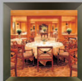
City Club of Tokyo Tokyo, Japan