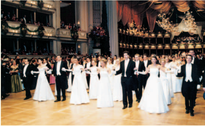
Was für ein Anblick: die strahlenden Debütantinnen beim Wiener Opernball. Eine „Mitglieds-Tochter“ war dieses Jahr live dabei.

In Österreich wohl das absolute gesellschaftliche Highlight des Jahres und ein Nonplusultra für alle Wichtigen, Reichen und Berühmten aus aller Welt