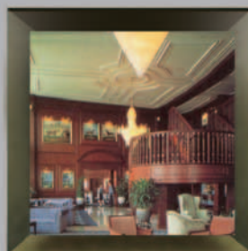
Bankers Club Kuala Lumpur, Malaysia