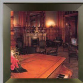
Mount Stephen Club Quebec, Canada

As a member of your club , you are entitled to worldwide non-resident membership privileges at over 250 private clubs within the International Associate Clubs (IAC) network. When you travel, simply log on to our website for full details of available clubs and amenities at your destination, then turn up at the club with your IAC Membership Card and enjoy the welcome reserved for the privileged.