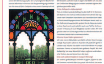
Die Cigars Lounge

Das New World ist ein Ort, an dem man sich entspannen und die Welt der Zigarren entdecken kann. Das New World ist ein Ort, an dem man sich entspannen und die Welt der Zigarren entdecken kann. Das New World ist ein Ort, an dem man sich entspannen und die Welt der Zigarren entdecken kann.