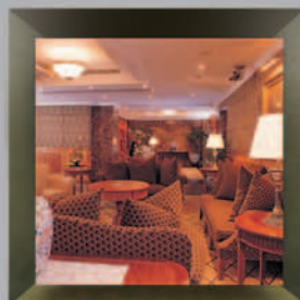
Chang An Club Beijing, China