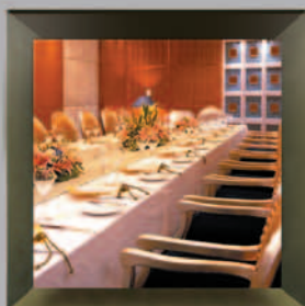
Tower Club Manila, Philippines