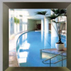
Tokyo Capital Club Tokyo, Japan