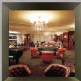
Century Club, Osaka, Japan