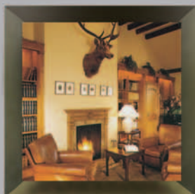
Cercle Munster Luxembourg

Access to over 250 associate clubs worldwide