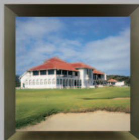
Humewood Golf Club Port Elizabeth, South Africa