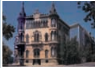
Circulo Equestre Barcelona, Spain

Access to over 250 associate clubs worldwide