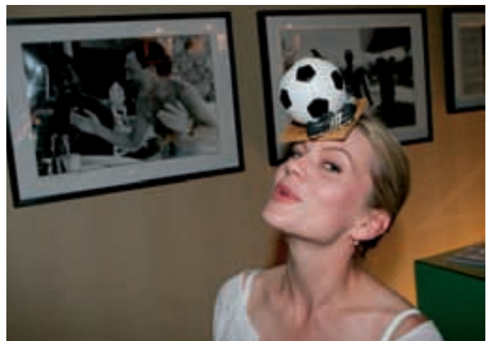
Fußballbegeisterte Schauspielerin Anna Loos-Liefers