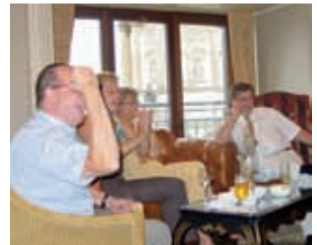
Natürlich wurde beim Spiel Deutschland gegen Argentinien so richtig angefeuert – mit Erfolg.

Wer hätte das noch vor Beginn des größten Fußball-Turniers der Welt gedacht? Deutschland wird Weltmeister – zumindest der Herzen. Wie knapp wir letztendlich sogar am richtigen Titel vorbeigeschlittert sind, konnten Mitglieder und deren Gäste im Berlin Capital Club jeden Tag der WM live erleben. Neben der Vattenfall International VIP Lounge in unserer Members Bar fieberten unsere Mitglieder auch in der Lounge und im Restaurant mit „Klinsi“, Ballack, Lehmann, Lahm und Co. Dank freundlicher Leihgaben aus dem Hause Bang & Olufsen verpassten die Zuschauer auf den 42-Zoll-Fernsehern kein Foul, keinen Angriff und schon gar kein Tor. Bei kühlen Getränken und fußballtauglichen Knabberereien wur-