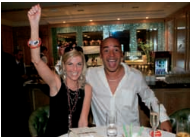
Tor für Deutschland! TV-Moderatorin Tanja Bültner und Lou Bega hielt es nicht mehr auf ihren Plätzen.