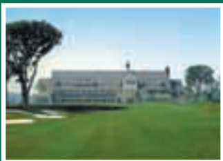
Windsor Park Golf & Country Club Nanakai, Japan