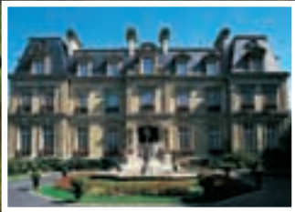
Saint James Paris Paris, France