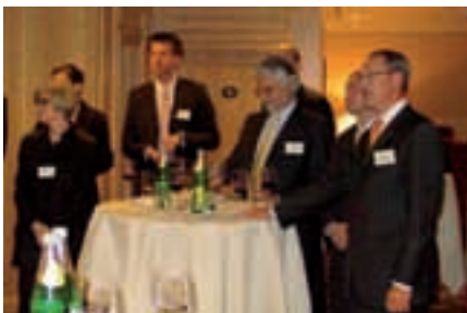
Großer Zuspruch von interessierten Mitgliedern

Möchten Sie gern mehr über andere Mitglieder erfahren? Dann sollten Sie dem nächsten „Who is Who“ anlässlich unserer Club Hour nicht fernbleiben. Beim letzten Mal stellten sich die Firmen „care4smile“, HICOM Agentur für Markenkommunikation und die Patentanwälte Gulde Hengelhaupt Ziebig & Schneider vor. Beim nächsten Mal könnten auch Sie Ihre Firma präsentieren und in angenehmer Atmosphäre wichtige Business-Kontakte knüpfen. Termine finden Sie im Veranstaltungskalender.