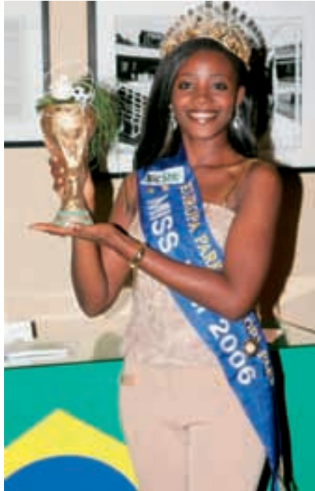
Miss WM 2006 aus Togo