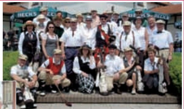
Die Teilnehmer des Thomas-Cook-Golf-History-Cups trugen stilechte Golf-Kleidung, dem 19. Jahrhundert nachempfunden.