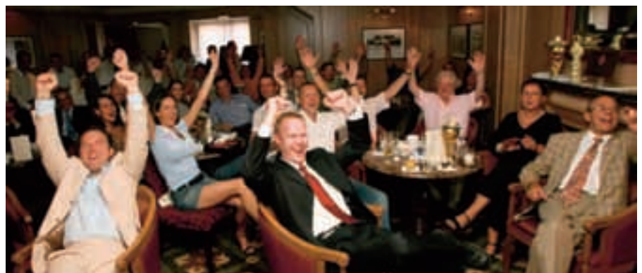
„Bei dieser Nationalmannschaft muss man einfach zum Fußball-Fan werden“, waren sich die Rundleder-Spezialisten in der Vattenfall VIP Lounge einig. So erging es wohl den meisten Deutschen. Unsere Mitglieder und Gäste jedenfalls waren Feuer und Flamme für die Kicker in Schwarz-Rot-Gold.