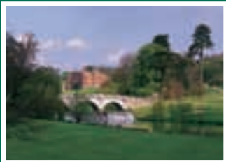
Brocket Hall Golf Club Welwyn, United Kingdom