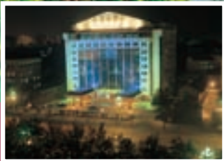
Chang An Club Beijing, China