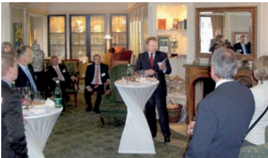
Auch zu unserer Club Hour hatten sich wieder zahlreiche Neu- und Alt-Mitglieder eingefunden.

Im geschützten Mitgliederbereich finden Sie bald unser neues Business TV. Riskieren Sie einen Blick unter www.berlincapitalclub.de .