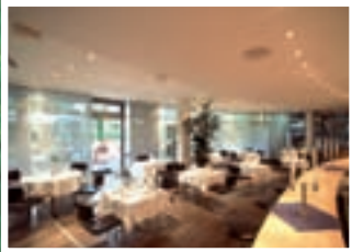
ROTONDA Business-Club Köln Cologne, Germany