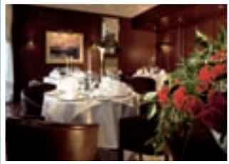
Ananda Business Club Munich Munich, Germany

Access to over 250 associate clubs worldwide