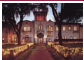
Epping Forest Yacht Club Florida, USA