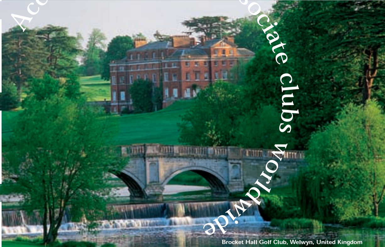
Brocket Hall Golf Club, Welwyn, United Kingdom

As a member of your club, you are entitled to worldwide non-resident membership privileges at over 250 private clubs within the International Associate Clubs (IAC) network. When you travel, simply log on to our website for full details of available clubs and amenities at your destination, then turn up at the club with your IAC Membership Card and enjoy the welcome reserved for the privileged.