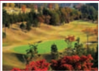
Windsor Park Golf & Country Club Nanakai, Japan