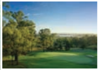
Cypress Lakes Golf & Country Club New South Wales, Australia