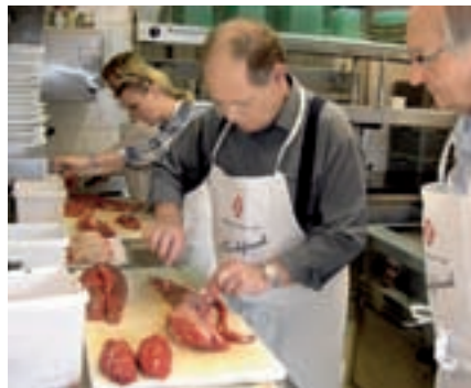
Mussten sich ihre kulinarische Belohnung erstmal verdienen: unsere Kochkurs-Teilnehmer beim Zubereiten des Kalbsfilets.

Doch aller Anfang war schwer. Und so bedurfte es doch der ausführlichen Anweisungen eines echten Chef de Cuisine, um ein Kalbsfilet in die gewünsch-