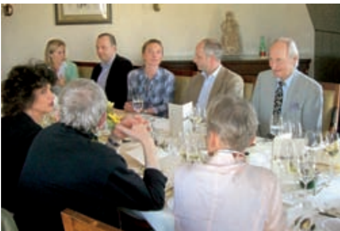
Nach dem Kochkurs konnte bei selbst zubereitetem Menü nach Herzenslust fachgesprächlich werden.

te Form zu bringen oder um ein Buttermilchmus aufzuschlagen. Die nur für den Kurs angefertigte Broschüre, in der Rezepte und Tipps für alle Teilnehmer notiert waren, konnte im Anschluss mit nach Hause genommen werden. Auch in Zukunft sind solche kulinarischen Veranstaltungen im Berlin Capital Club geplant. Jens Wegner freut sich, Sie oft bei uns zu begrüßen, um seine Kreationen zu genießen.