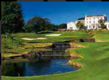
Druids Glen Golf Club, Irland