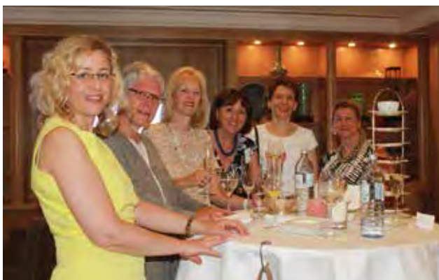
Prächtige Stimmung herrschte beim „Sommer get together“ unserer Damen.

07. Juli 2015 und 08. September 2015, Berlin Capital Club