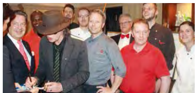
Udo Lindenberg gab Gala-Gästen und dem Club-Team gerne Autogramme.