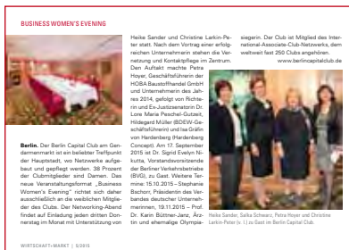
Wirtschaft + Markt