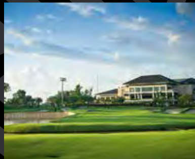
Royale Jakarta Golf Club, Indonesien