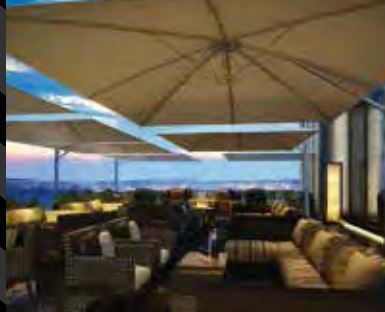
Capital Club East Africa, Kenia