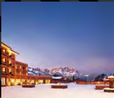
Kitzbühel Country Club, Österreich

Als Mitglied des Berlin Capital Club haben Sie die Möglichkeit, fast 250 exklusive Stadt-, Sport-, Country- und Golfclubs gegen Vorlage Ihrer persönlichen IAC-Karte weltweit zu nutzen. So bieten Ihnen die renommierten Clubs in vielen europäischen Metropolen ein „Home away from Home“. Besuchen Sie bei Ihrer nächsten Reise doch einmal den Capital Club East Africa, Druids Glen Golf Club, Royale Jakarta Golf Club oder den Kitzbühel Country Club. Der Kitzbühel Country Club bietet IAC-Mitgliedern attraktive Packages an, die Sie jeweils auf unserer Webpage finden.