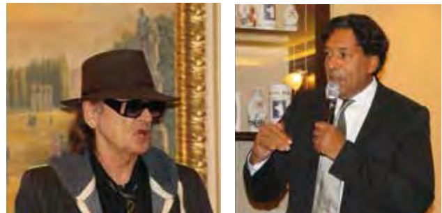
Ehrgast Udo Lindenberg sang und stiftete drei Bilder für die Auktion.