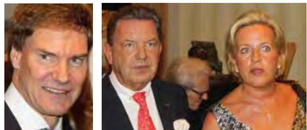
Ersteigerte ein Bild: Carsten Maschmeyer