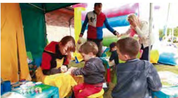
Spiel und Spaß für die Kleinsten