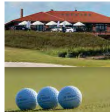
Das Clubhaus des Toya Golf & Country Club