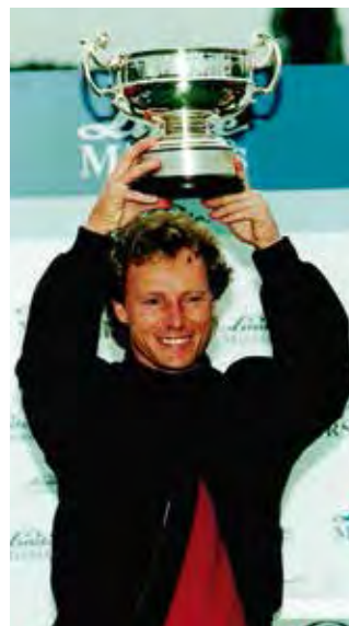
Bernhard Langer gewann 1997 die Linde German Masters in Motzen mit Rundenrekord (60 Schläge).

Ob als Teamspieler, Zuschauer oder aktiver Gast, wir freuen uns auf Ihr Kommen bei den 3. BB-Masters im Berliner Golf & Country Club Motzener See e.V.