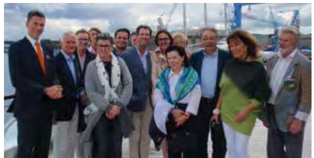
Unsere Mitglieder besichtigten exklusiv die schönste Yacht der Welt.