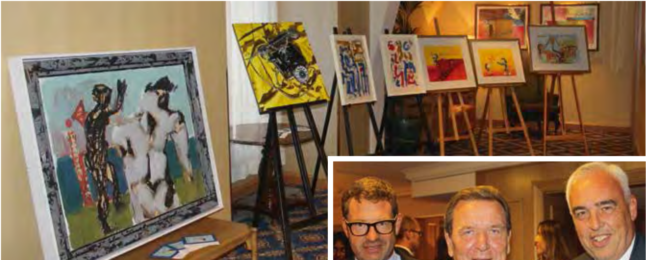
Diese sieben besonderen Bilder wurden auf der ALS-Gala unter den Gästen und Prominenten für den guten Zweck versteigert.