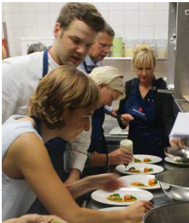
Impressionen vom Kochkurs am 19. September 2015

Schalotten in feine Würfel schneiden. Waldpilze putzen und ebenfalls klein schneiden. In einer Pfanne wenig Olivenöl erhitzen und die Pilze zusammen mit den Schalotten anbraten. Mit Salz und Pfeffer abschmecken, Petersilie untermischen, auf einen Teller geben und abkühlen lassen. Einen Metallring mit ca. 8 cm Durchmesser buttern. Aus dem Crêpe in gleicher Größe sechs Kreise ausstechen. Die Pilzmasse mit dem Eigelb verrühren und nochmals abschmecken. Nun die sechs Crêpe-Kreise und die Pilzmasse wie eine Lasagne gleichmäßig einschichten. Mit Butter bepinseln und mit Folie abdecken. Backofen auf 90°C vorheizen und die Schwammerltarte 40 Minuten stocken lassen. Einen Topf mit Wasser aufstellen und auf 68°C erhitzen. Die vakuumierten Taubenbrüste darin 6–7 Minuten gar ziehen lassen und anschließend 10 Minuten ruhen lassen. In der Zwischenzeit das Karottenpüree erhitzen und ggf. nachschmecken. Warme Schwammerltarte in kleine Tortenstücke schneiden. Taubenbrüste schräg halbieren. Waldpilze in Butter anbraten, abschmecken und alles zusammen anrichten.