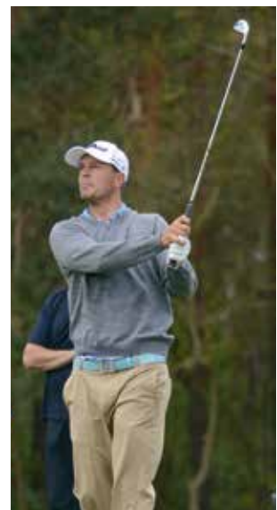
Jonas Kölbling, der deutsche PGA-Meister 2015, gehört natürlich zu den Top-Favoriten 2016.