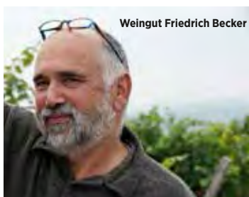
Weingut Friedrich Becker