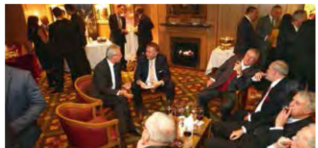
Impressionen vom Event 2014